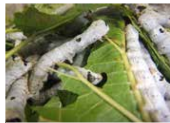
カイコによるタンパク質生産 (昆虫科学・新産業創生研究センター)