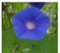
最先端イメージング技術(研究教育支援センター) 植物フロンティア研究センター